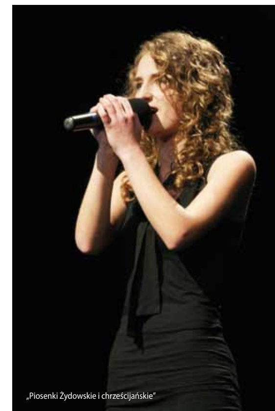
„Piosenki Żydowskie i chrześcijańskie”