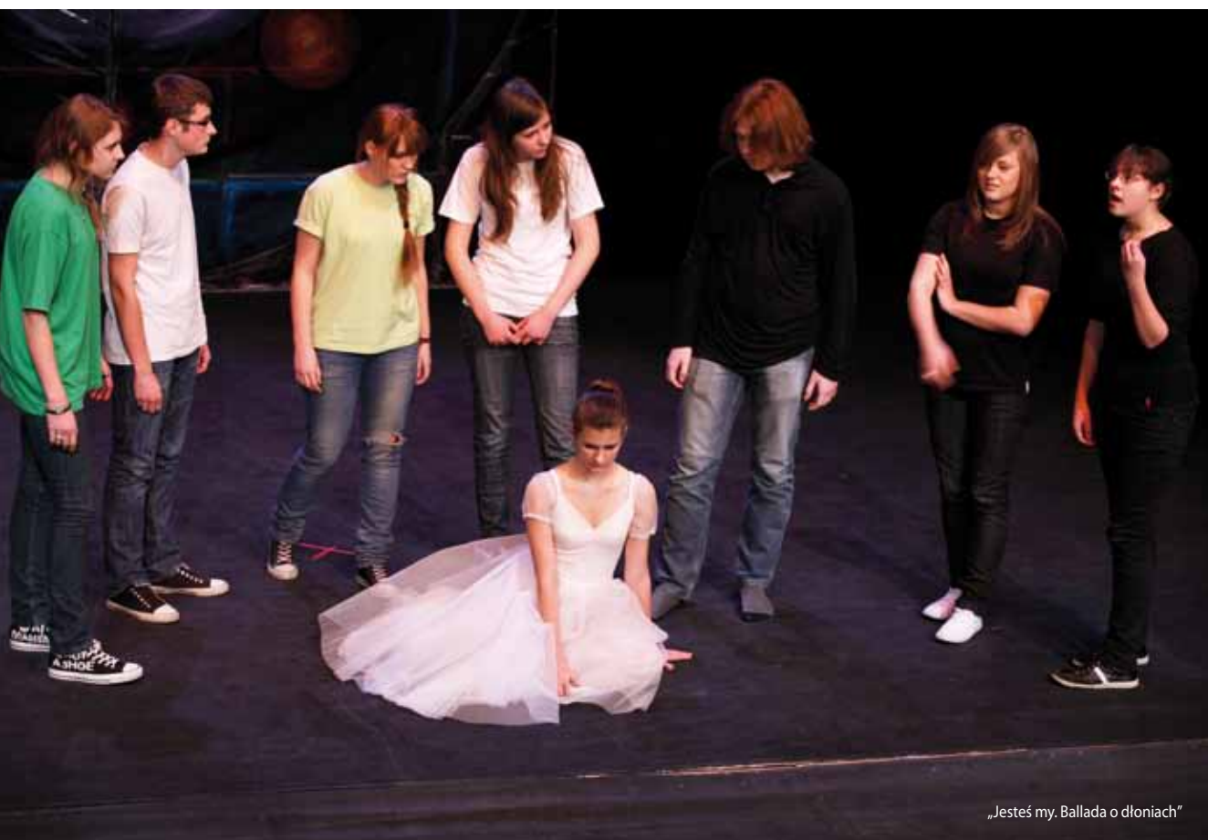
„Jesteś my. Ballada o dłoniach”

– Dzieci, z którymi pracuję, są bardzo ciężko doświadczone przez los. Przygotowanie z nimi spektaklu jest z jednej strony wielkim wyzwaniem, a z drugiej – szczęściem, daje ogromną satysfakcję. Przy pełnosprawnej młodzieży niepełnosprawni bardziej się otwierają i starają. Z kolei pełnosprawną młodzież, przygotowując integracyjny spektakl, uczy się empatii i tej fenomenalnej, genialnej wrażliwości, którą niepełnosprawni posiadają. Z takiego spektaklu płyną też korzyści dla widzów, którzy poszerzają swoje horyzonty umysłowe, wyostrzają empatię i próg wrażliwości nie tylko na sztukę, ale przede wszystkim na drugiego człowieka, na inną kulturę. Równie ważne jest uzyskanie dystansu i obiektywizmu w ocenianiu otaczającego świata