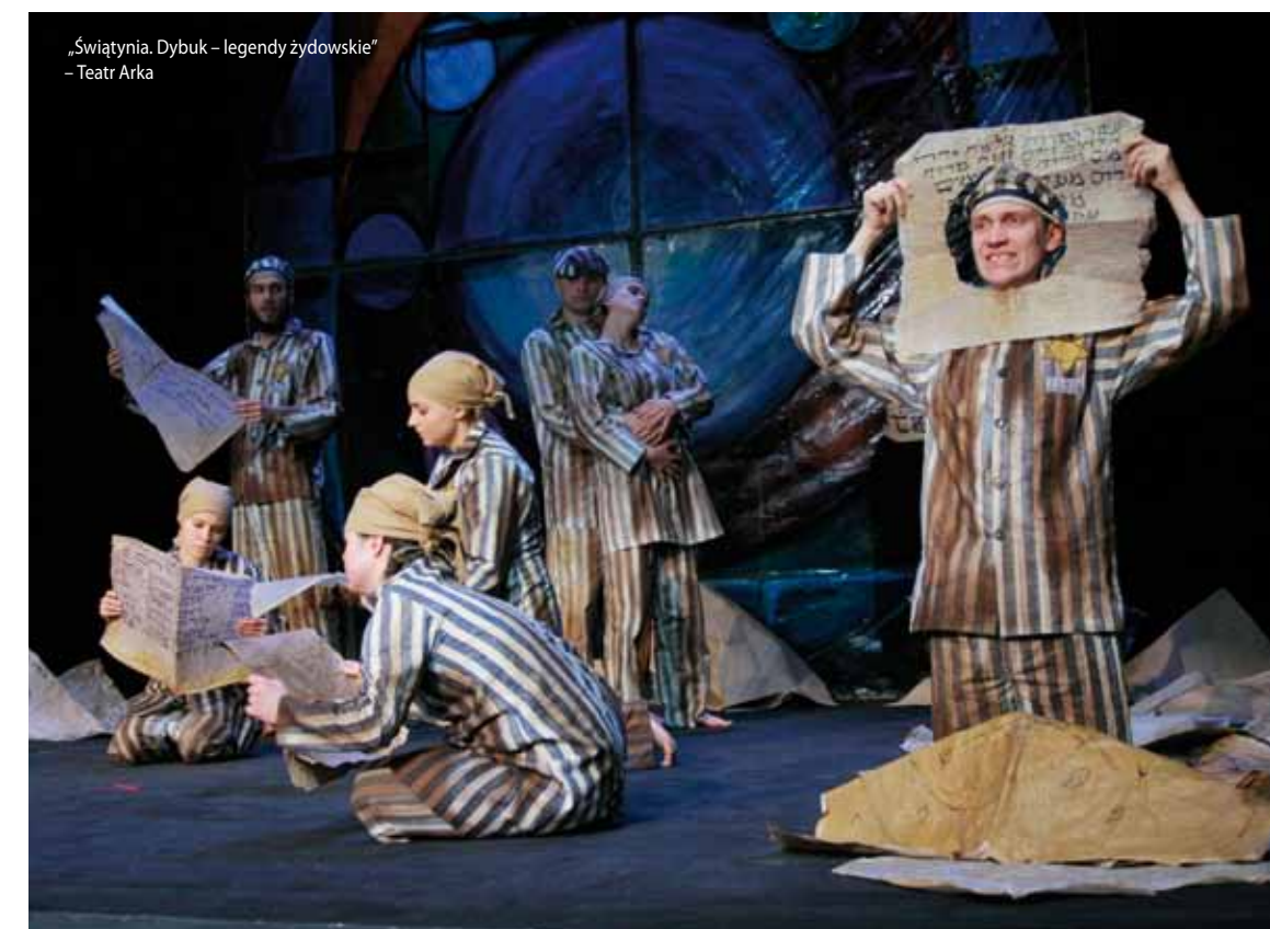
„Świątynia. Dybuk – legendy żydowskie” – Teatr Arka