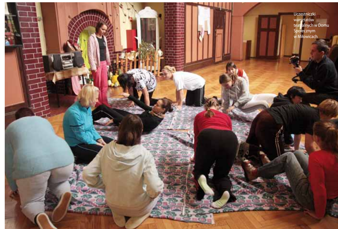
Uczestniczki warsztatów teatralnych w Domu Społecznym w Miłowicach